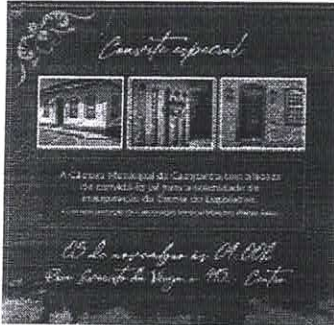
Câmara Municipal da Campanha (1).jpg 1309K

Câmara Municipal de Silvianópolis-MG <camara@silvianopolis.cam.mg.gov.br> Para: admcamaracampanha@gmail.com